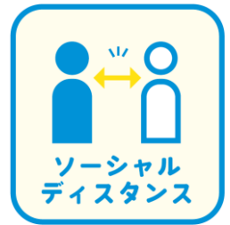
ソーシャル ディスタンス