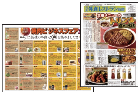
日食外食レストラン新聞